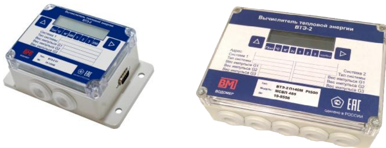
Рисунок 1– Общий вид средства измерений